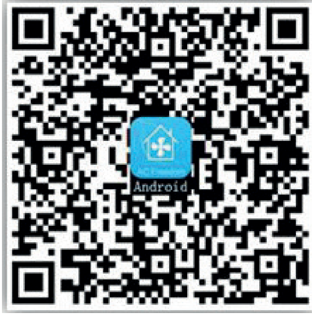
Şekil 1-a) Android sistemleri için