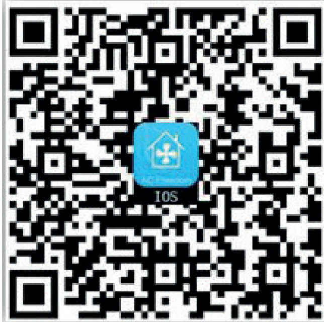
Şekil 1-b) iOS sistemleri için